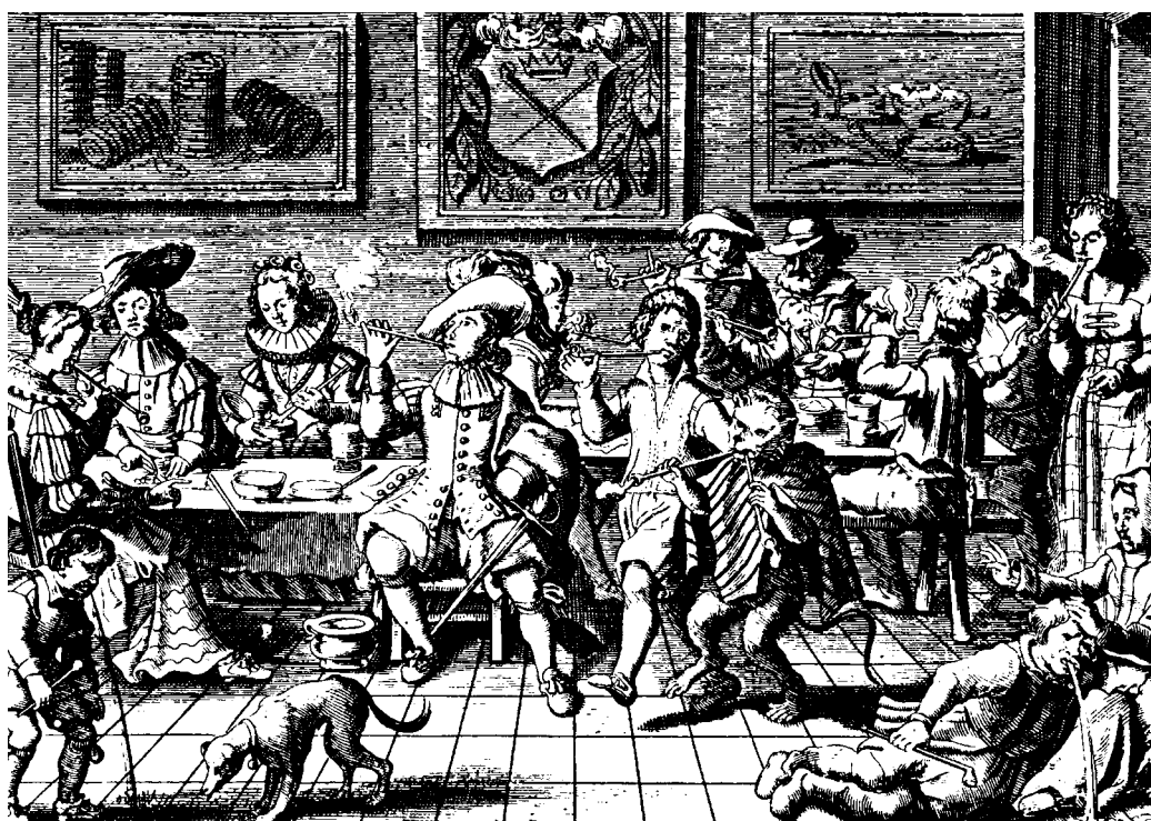
Selskab af tobaksdrikkere.

Fra slutningen af 1600-tallet var det moderne at snuse i Europa, og så skulle der igen undervises. At åbne en snusdåse, placere snusen på hånden og selve det at indsnuse var ikke bare noget man gjorde. Det var omgærdet af en række ritualer. I 1700-tallet var selve snustobaksdåsen blevet tidens måske vigtigste statussymbol, og sølvsmedene havde travlt med at efterkomme borgerskabets efterspørgsel på dåser af sølv. Snus var dog ikke kun for den velhavende del af befolkningen. Fattige snusede med samme iver, selv om de ikke brugte sølvdåser, men simple snushorn eller hjemmesnittede træbeholdere.